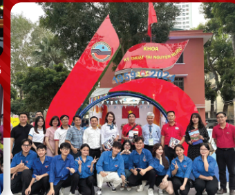
Giải đặc biệt Hội trại truyền thống kỷ niệm 65 năm thành lập Trường

Phong trào thanh niên Khoa Kỹ thuật tài nguyên nước sôi nổi với văn nghệ, thể thao, tình nguyện và hoạt động cộng đồng - nơi sinh viên vừa vững chuyên môn, vừa phát triển toàn diện và khám phá bản thân.