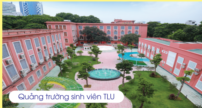
Quảng trường sinh viên TLU