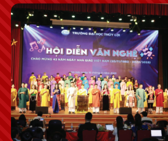
Giải nhất Hội diễn văn nghệ thường niên 2025