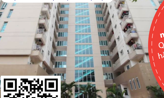
Ký túc xá Đại Học Thủy Lợi

Sau thời gian đào tạo từ 4,5 năm với 155 tín chỉ, kỹ sư tốt nghiệp từ các ngành trong Khoa có khả năng: Quy hoạch, thiết kế, thi công và vận hành các hệ thống thủy lợi, cấp thoát nước, hạ tầng kỹ thuật, giao thông; nghiên cứu và đề xuất các giải pháp phòng, chống và giảm thiểu thiệt hại do thiên tai, bảo vệ môi trường và thích ứng với biến đổi khí hậu.