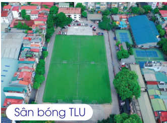
Sân bóng TLU