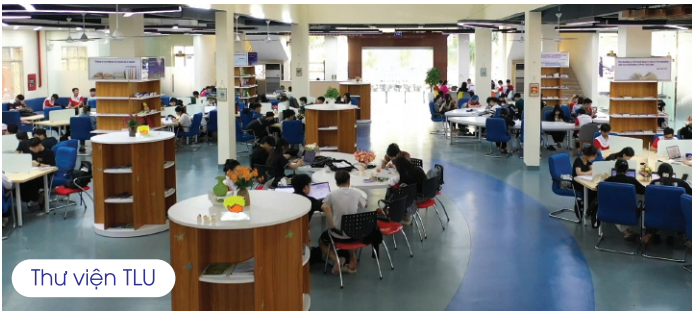
Thư viện TLU