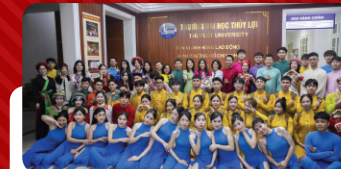
Đội văn nghệ Khoa KTNN