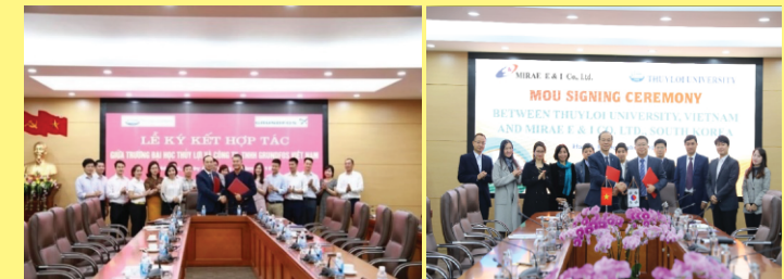
Hợp tác với công ty TNHH Grundfos Việt Nam

Trường Đại học Thủy Lợi đã có hợp tác chặt chẽ với nhiều đối tác để tăng cơ hội học tập, nghiên cứu và việc làm cho sinh viên Khoa Kỹ thuật tài nguyên nước.