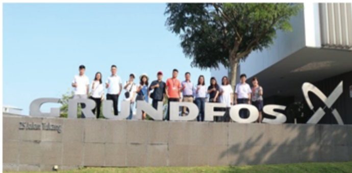
Sinh viên được nhận học bổng của các tổ chức trong nước và quốc tế