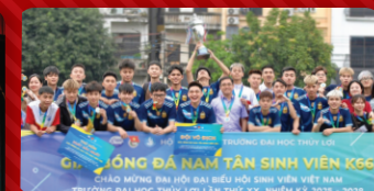
Vô địch giải bóng đá tân sinh viên K66