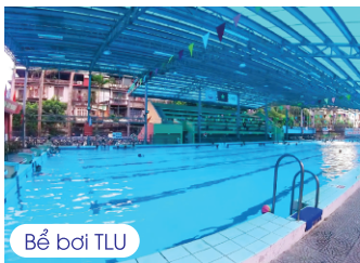
Bể bơi TLU