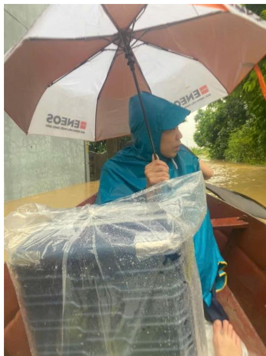
(Thầy di chuyển bằng thuyền qua khu vực khác để tránh lũ)