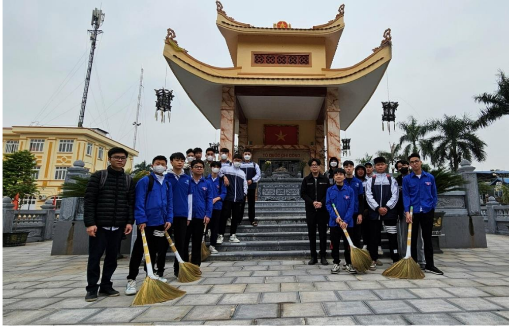
Các đoàn viên TT vệ sinh đài tưởng niệm liệt sĩ xã Đông Mỹ