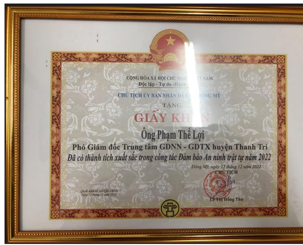
Giấy khen của xã Đông Mỹ năm 2022

Sau công việc bận bịu, thầy lại trở về với mái ấm gia đình, để làm một người cha mẫu mực, một người chồng hết lòng yêu thương vợ, con. Thầy rất tự hào mỗi khi nói về người vợ giỏi giang, đảm đang cùng sự thành đạt, ngoan ngoãn của 2 con trai. Là một gia đình có truyền thống hiếu học, có cha mẹ cùng làm trong ngành giáo dục. Các con trai thầy lại tiếp bước sự nghiệp của cha mẹ, lựa chọn nghề y và nghề giáo để được cống hiến cái đức cái tài cho xã hội. Có lẽ gia đình chính là động lực lớn giúp thầy yên tâm công tác và cống hiến cho sự nghiệp trồng người vẻ vang này.