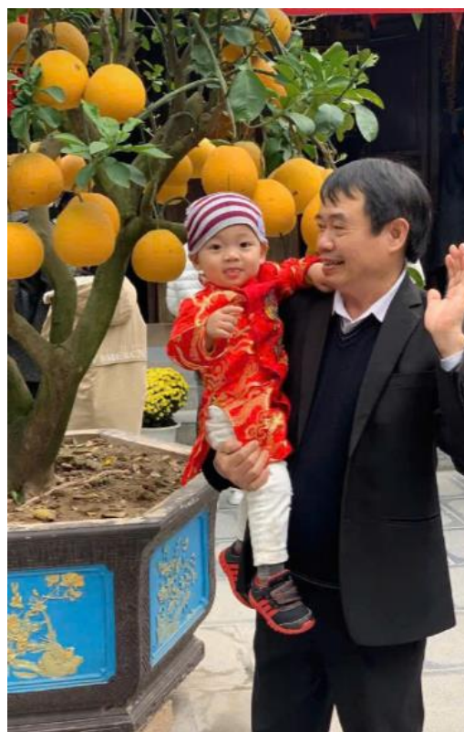
Ông nội và cháu

Sau công việc bận bịu, thầy lại trở về với mái ấm gia đình, để làm một người cha mẫu mực, một người chồng hết lòng yêu thương vợ, con. Thầy rất tự hào mỗi khi nói về người vợ giỏi giang, đảm đang cùng sự thành đạt, ngoan ngoãn của 2 con trai. Là một gia đình có truyền thống hiếu học, có cha mẹ cùng làm trong ngành giáo dục. Các con trai thầy lại tiếp bước sự nghiệp của cha mẹ, lựa chọn nghề y và nghề giáo để được cống hiến cái đức cái tài cho xã hội. Có lẽ gia đình chính là động lực lớn giúp thầy yên tâm công tác và cống hiến cho sự nghiệp trồng người vẻ vang này.