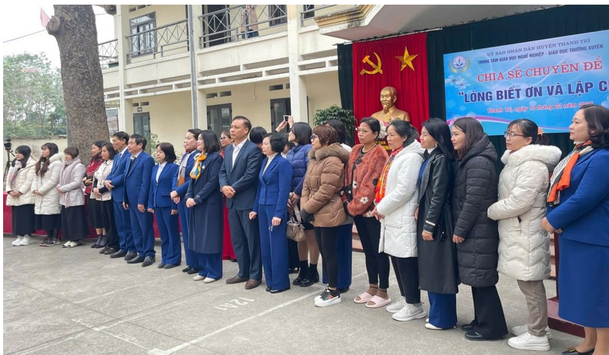
Cán bộ, Giáo viên, Nhân viên và đại diện Ban phụ huynh Trung tâm GDNN –GDTX huyện Thanh Trì trong buổi ngoại khóa Chuyên đề: Lòng biết ơn và lập chí